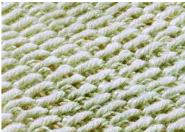
Celotkaná kostra před impregnací PVC

Celotkaná kostra Fenoplast má velmi složitou konstrukci využívající osnovu propletenou a spojenou do jediné kompaktní masy pomocí jedinečného systému provázané osnovy. Používá se nylon nebo polyester pro zatěžovanou osnovu a nylon nebo nylon/bavlna jako útek. Různé kombinace těchto syntetických a přírodních vláken zaručují splnění požadavků na odolnost proti nárazům, prodloužení pásu, pružnost (pro žlaby a vedení kolem bubnů s malým průměrem), nosnost a upevnění spojovacích prvků. Pokud je speciálně zapotřebí, je možné odolnost proti nárazům dále zvýšit použitím bavlněných vláken v osnově. V případě potřeby lze dále zpevnit okraje.